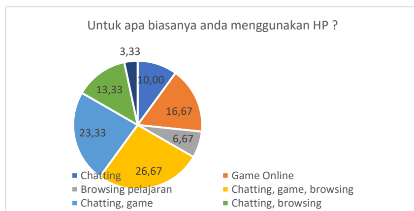
Gambar 1. Data penggunaan HP

Berdasarkan hasil data diatas dapat diketahui bahwa semua siswa memiliki handphone tetapi hanya sebanyak 6,67 % yang menggunakan Hp untuk browsing pelajaran, yang jika dibandingkan dengan penggunaan Hp untuk gameonline sebesar 16,67% yang lebih banyak.