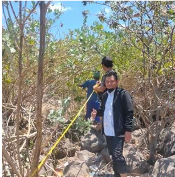
Gambar 2 Kegiatan survei lapangan