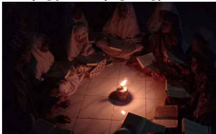
Gambar 1 Aktivitas pengajian di Kampung Lo'ang pada malam hari

Lokasi yang dipilih untuk kegiatan PkM ini adalah Kampung Lo'ang, yang terletak di pesisir pantai Pulau Besar, Desa Kojagete, NTT. Kampung ini dipilih karena merupakan daerah 3T yang hingga saat ini belum mendapatkan akses listrik dari negara (Syafii, 2018). Penduduk di Kampung Lo'ang sebagian besar hidup di bawah garis kemiskinan sehingga hanya segelintir orang saja diantara mereka yang mampu membeli genset untuk memenuhi kebutuhan terhadap energi listrik (Perizade, 2011). Setiap hari sebagian besar warga menggunakan pelita sebagai sumber penerangan seperti terlihat pada gambar 1.