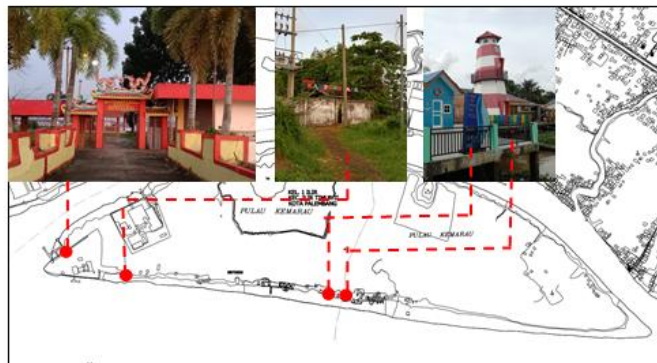
Gambar 8 Signage di Pulau Kemaro