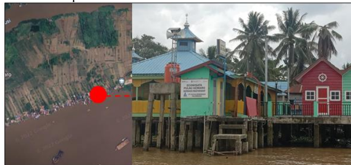
Gambar 6 Masjid di Pulau Kemaro