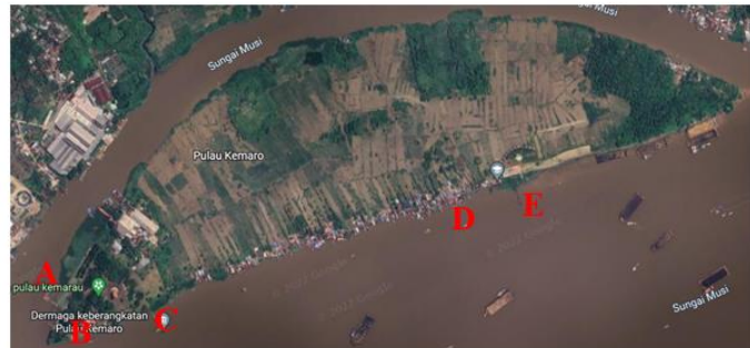
Gambar 7 Dermaga di Pulau Kemaro