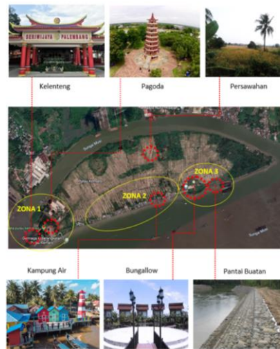
Gambar 1 Lokasi Penelitian

penduduk, serta zona III terdapat bungallow dan pantai buatan. Pembagian zona di Pulau Kemaro digunakan untuk membagi atau mengkategorikan wilayah berdasarkan fungsinya. Pada zona I difungsikan untuk tempat beribadah, kawasan bersejarah dan wisata yang bersifat semi publik, pada zona II difungsikan sebagai permukiman dan wisata yang bersifat semi publik, serta zona III difungsikan sebagai tempat wisata yang bersifat publik. Pembagian zona ini digunakan agar konsep pemetaan menjadi tepat sasaran sesuai sifat dan kebutuhan lingkungan di Pulau Kemaro.