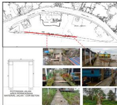
Gambar 5 Pedestrian di Pulau Kemaro