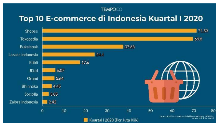
Gambar 2 Persaingan E-commerce terbaik di Indonesia Sumber: (Naufaly et al., 2020)

Gambar 2 menunjukkan persaingan e-commerce pada tahun 2020. Tokopedia menerima kunjungan peringkat kedua terbanyak dengan 69,8 pengunjung. Pada kuartal III 2020, kunjungan situs Tokopedia mencapai 84 juta per bulan, mengalami peningkatan sebesar 25% dari tahun 2020. Total pengunjung situs Tokopedia mengalami peningkatan sebesar 40% jika dibandingkan dengan kuartal III tahun 2019. Pada kuartal III 2019, rata-rata kunjungan bulanan hanya mencapai 60 juta. Pada tahun 2019, total jumlah kunjungan situs Tokopedia memiliki pengunjung terbanyak dan merupakan satu-satunya e-commerce lokal di Asia Tenggara, hal ini sebanding dengan Lazada dan juga Shopee. Pada tahun 2019, Tokopedia berhasil mencapai 900 juta kunjungan ke situs mereka. Tokopedia lebih berfokus untuk dapat menguasai pasar Indonesia dan mampu bersaing dengan Shopee dan Lazada yang tergolong e-commerce regional (Devita, 2020).