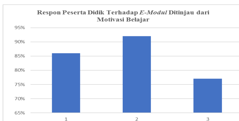
Gambar 2 Respon peserta didik terhadap e-modul ditinjau dari motivasi belajar

Pada tahap analisis berikutnya adalah penilaian penggunaan E-Modul menggunakan CANVA ditinjau dari minat belajar peserta didik. Berdasarkan analisis data yang telah dilakukan menyatakan bahwa minat belajar peserta didik terhadap E-Modul sangat tinggi. Hal ini berdampak baik karena pembelajaran daring dengan menggunakan E-Modul menggunakan aplikasi CANVA dapat menambah minat belajar peserta didik untuk lebih memahami materi tentang Kredit Perbankan.