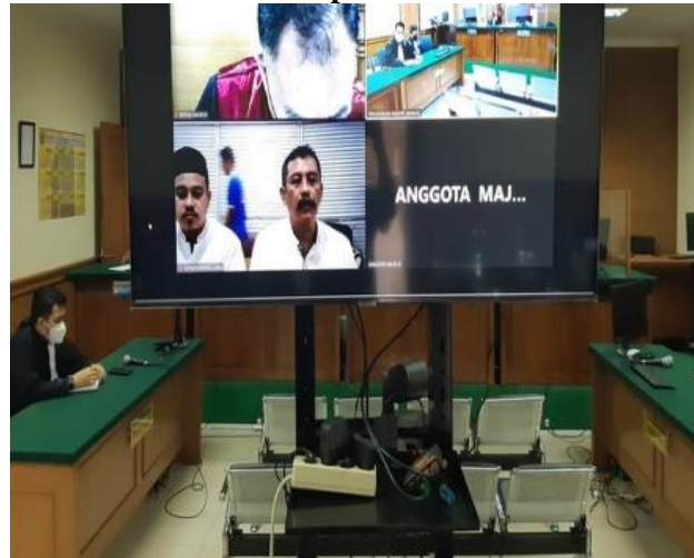
Gambar 3 Kasus Korupsi Dana Desa 2