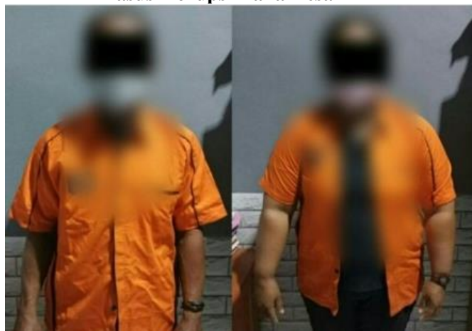
Gambar 2 Kasus Korupsi Dana Desa 1

Kecurangan kasus penyalahgunaan dana desa sudah banyak terjadi di Indonesia. Kasus terbaru yaitu kasus penyalahgunaan keuangan desa oleh oknum mantan pejabat desa (Kades) berinisial BR (50) dan Bendahara berinisial WT (43) di salah satu desa pada Kecamatan Nanusa, Kabupaten Kepulauan Talaud, Sulawesi Utara (Sulut), mereka ditetapkan sebagai tersangka atas kasus dugaan korupsi dana desa sebesar Rp 480 juta. (www.kompas.com). Kasus lain juga terjadi di Desa Sodong, Kabupaten Pandeglang, Kepala desa mendapatkan hukuman kurungan penjara selama 3 tahun dan 4 bulan sebagai balasan atas korupsi dari dana desa senilai Rp 418 juta. Begitu juga anaknya, yang bekerja sebagai kepala urusan (Kaur) keuangan desa, juga mendapatkan hukuman dengan hukuman sama (www.detik.com). Kasus lain juga terjadi di lamongan. Rali Sugiarto (47) mantan perangkat desa dan tim pelaksana proyek dana desa (DD) Desa Sumberejo Kecamatan Pucuk Lamongan Jawa Timur. Tersangka di tangkap saat melakukan pelarian di daerah kalimantan setelah dua tahun masuk menjadi daftar pencarian orang (www.detik.com).